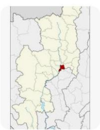
W วิถีพีเดีย อำเภอสารภี - วิถีพีเดีย