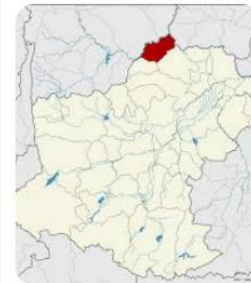
W วิกีพีเดีย อำเภอแก่งสนามนาง - ...

คำพิพากษาฎีกาที่ ๓๔๖๖/๒๕๔๗ คดีนี้ข้อเท็จจริงยังฟังไม่ชัดเจนว่า เหตุเกิดในท้องที่ใดแน่ ระหว่างอำเภอบัวใหญ่กับอำเภอแก่งสนามนาง แต่จำเลยถูกจับกุมที่อำเภอแก่งสนามนาง โดยมีเจ้าพนักงานตำรวจสถานีตำรวจภูธรอำเภอบัวใหญ่หลายคนเป็นผู้ร่วมจับกุม ดังนั้น พนักงานสอบสวนผู้รับผิดชอบในคดีนี้ คือ พนักงานสอบสวนสถานีตำรวจภูธรอำเภอแก่งสนามนาง มิใช่พนักงานสอบสวนสถานีตำรวจภูธรอำเภอบัวใหญ่ เมื่อพนักงานสอบสวนสถานีตำรวจภูธรอำเภอบัวใหญ่ซึ่งมิใช่พนักงานสอบสวนผู้รับผิดชอบเป็นผู้สรุปสำนวนและทำความเข้าใจว่า ควรสั่งฟ้องหรือสั่งไม่ฟ้องจำเลยคดีนี้ แล้วส่งสำนวนเพื่อให้พนักงานอัยการพิจารณาตามที่บัญญัติไว้ในมาตรา ๑๔๐ และ ๑๔๑ ก็ถือไม่ได้ว่ามีการสอบสวนในความผิดนั้น โดยชอบตาม ป.วิ.อ. มาตรา ๑๒๐ โจทก์จึงไม่มีอำนาจฟ้อง