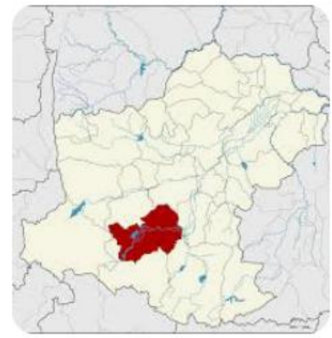
W วิกิพีเดีย อำเภอปทุมธานี - วิกิพีเดีย

คำพิพากษาฎีกาที่ ๓๒๗๐-๓๒๗๑/๒๕๖๔ คดีนี้พนักงานสอบสวนในท้องที่หนึ่งท้องที่ใดที่เกี่ยวข้อง มีอำนาจสอบสวนได้ตาม ป.วิ.อ. มาตรา ๑๘ วรรคสอง แต่ตามวรรคสอง (ข) ของมาตราดังกล่าวระบุไว้ชัดว่า พนักงานสอบสวนที่เป็นผู้รับผิดชอบในการสอบสวน คือ พนักงานสอบสวนซึ่งท้องที่ที่พบการกระทำผิดก่อนอยู่ในเขตอำนาจ ผู้เสียหายทั้งสิบสี่แจ้งความร้องทุกข์ ให้ดำเนินคดีแก่จำเลยทั้งสี่ ในฐานะความผิดฉ้อโกงประชาชนที่สถานีตำรวจภูธรปทุมธานี จังหวัดนครราชสีมา โดยมีพันตำรวจตรี ป. เป็นพนักงานสอบสวนจึงเป็นท้องที่ที่พบการกระทำผิดก่อน ฉะนั้น พนักงานสอบสวนผู้รับผิดชอบในคดีนี้ คือ พนักงานสอบสวนสถานีตำรวจภูธรปทุมธานี ซึ่งตาม ป.วิ.อ. มาตรา ๑๔๐ บัญญัติให้พนักงานสอบสวนผู้รับผิดชอบในสำนวนเป็นผู้สรุปสำนวนและทำความเข้าใจ พนักงานสอบสวนสถานีตำรวจภูธรบ้านเขว้า จังหวัดชัยภูมิ เมื่อร้อยตำรวจเอก ว. พนักงานสอบสวนสถานีตำรวจภูธรบ้านเขว้า มิใช่พนักงานสอบสวนผู้รับผิดชอบในการสอบสวนเป็นผู้สรุปสำนวนและทำความเข้าใจควรส่งฟ้องไปพร้อมสำนวนเพื่อให้พนักงานอัยการพิจารณา แม้จะดำเนินการสอบสวนต่อไปจนเสร็จ ก็ถือไม่ได้ว่าได้มีการสอบสวนในความผิดนั้นโดยชอบตาม ป.วิ.อ. มาตรา ๑๒๐ โจทก์จึงไม่มีอำนาจฟ้อง