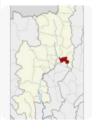
W วิถีพีเดีย อำเภอสันกำแพง - วิ...

เหตุตามฟ้องความผิดกระทำชำเราเกิดสองท้องที่คือ ท้องที่สถานีตำรวจภูธร สันกำแพงและสถานีตำรวจภูธรสารภี เมื่อพนักงานสอบสวนสถานีตำรวจภูธรสารภี ได้รับคำร้องทุกข์คดีนี้ รวบรวมพยานหลักฐานแล้วเชื่อว่า จำเลยกระทำความผิด จึงออกหมายเรียกให้จำเลยมาพบ จากนั้นจำเลยเข้ามามอบตัวต่อพนักงานสอบสวน พนักงานสอบสวนสถานีตำรวจภูธรสารภีย่อมมีอำนาจสอบสวนความผิดกรรมที่เกิด ในเขตท้องที่สถานีตำรวจภูธรสันกำแพงด้วยตามประมวลกฎหมายวิธีพิจารณา ความอาญามาตรา ๑๙ วรรคหนึ่ง (๔) และเมื่อเป็นกรณีจับผู้ต้องหาซึ่งยังไม่ได้ พนักงานสอบสวนสถานีตำรวจภูธรสารภีซึ่งได้รับคำร้องทุกข์ไว้เป็นผู้พบการกระทำ ความผิดก่อน จึงเป็นผู้รับผิดชอบในการสอบสวนที่จะสรุปสำนวนส่งพนักงานอัยการ ตามมาตรา ๑๙ วรรคสอง (ข)