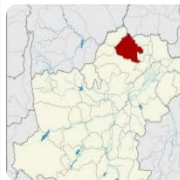
W วิกีพีเดีย อำเภอบัวใหญ่ - วิกีพีเดีย