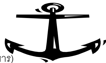
มานิตย์ จุมปา รัฐธรรมนุญ เนติฯ